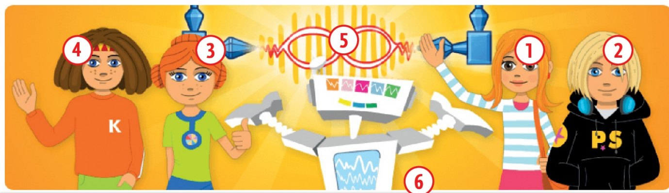
Rys. 1. Drużyna Sieciaków, NetRobi i Sztuczna Inteligencja

Przygody Sieciaków możesz śledzić w serwisie www.sieciaki.pl , przeznaczonym dla najmłodszych internautów – użytkowników internetu – aby mogli bezpiecznie korzystać z sieci po lekcjach, w domu. Czekają tam na ciebie kreskówki, komiksy i gry.